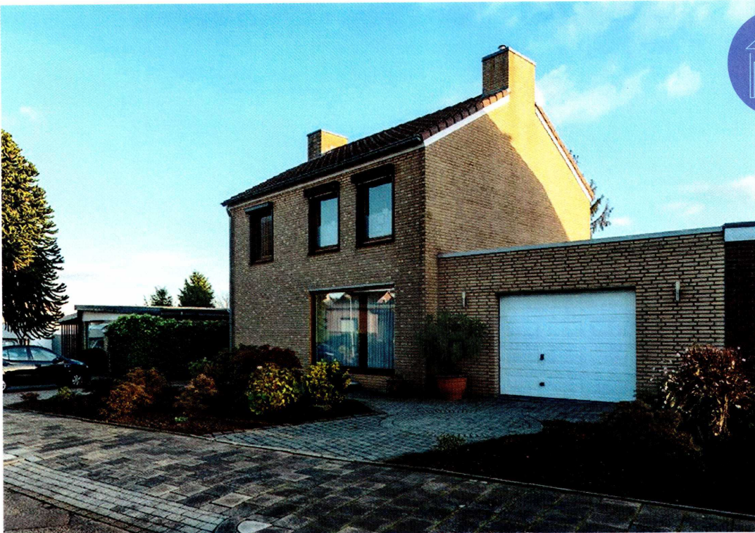
Vrijstaand woonhuis met 2 garages en een siertuin gelegen te